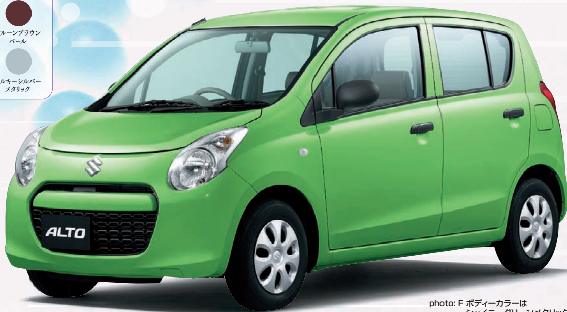
ボディーカラーは シャイニーグリーンメタリック